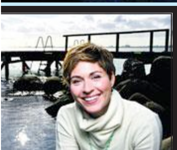
TURNÉKLAR: Sissel Kyrkjebø.