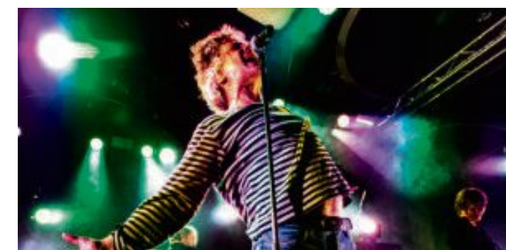
Prepple Houmb var i super form på DumDum Boys-konsertene denne sommeren. Samlealbumet «Losøre» er også av høy klasse.

JOAKIM S. WANGEN 924 91 996 joakim.slettebak.wangen@adresseavisen.no