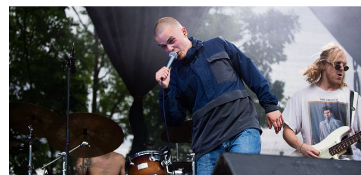
Combos spilte på Pstereofestivalen i sommer.