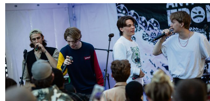
Rapperne i Bulmboy$ er klare for Trondheim Calling.

Når Trondheim Calling inntar byens scener i månedsskiftet januar/februar, er settet deres trolig godt innøvd. For den tid